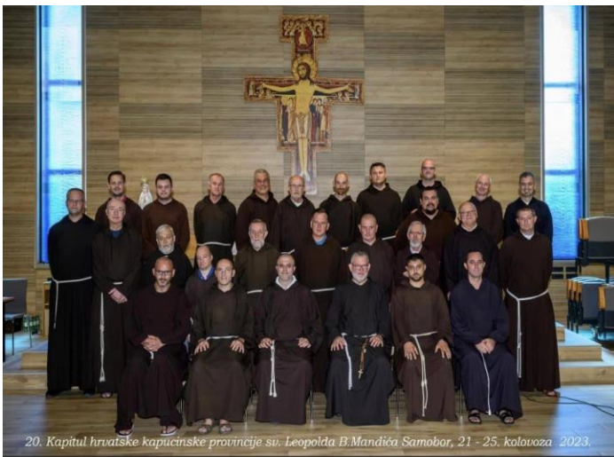
20. Kapitul hrvatske kapucinske provincije sv. Leopolda B.Mandića Samobor, 21 - 25. kolovoza 2023.